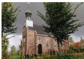
Kerk Terkaple Kerk